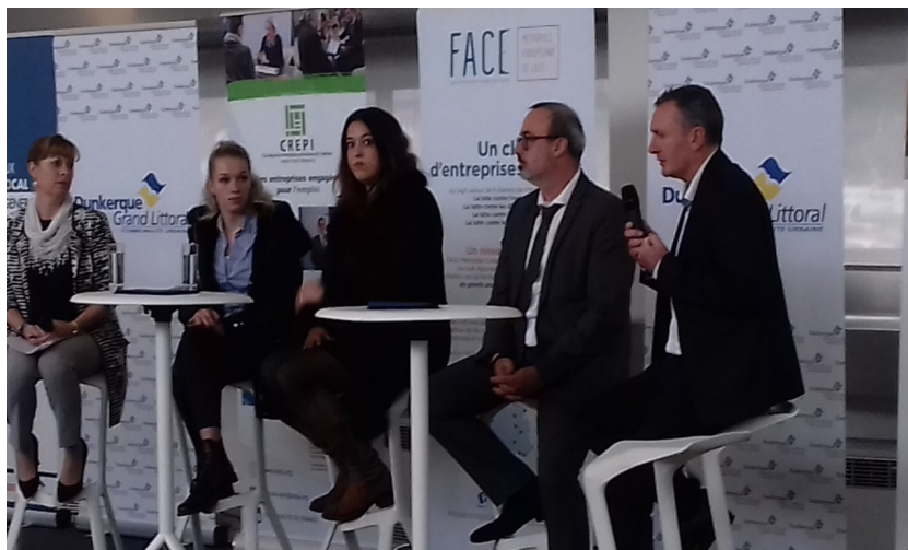
De nouvelles entreprises signataires du PAQTE- CAP DUNE et AXIAN